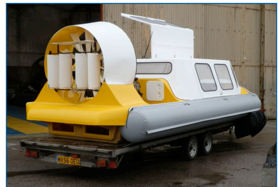
Nieuwe hovercraft Vortex 7+ in aanbouw

Maak dan nu uw donatie over aan Stichting HoverAid Nederland o.v.v. 'nieuwe auto'.