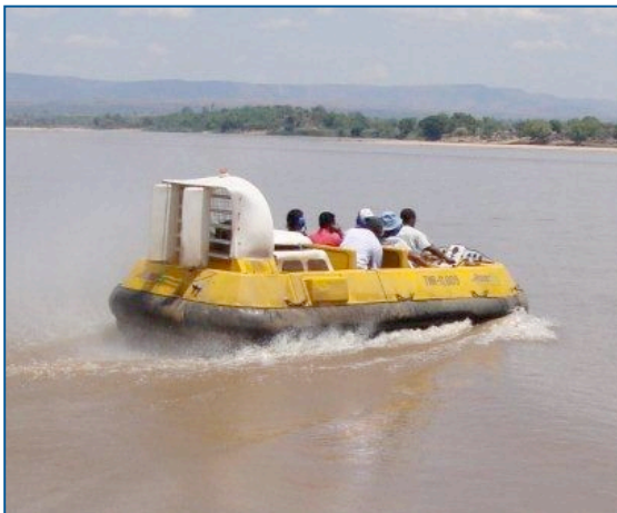
De Vortex 5+ tijdens het vervoeren van artsen

De hovercraft Vortex 5+ is veilig aangekomen in Madagaskar en heeft alle testen ondergaan. Ook met deze hovercraft worden patiënten en artsen vervoerd maar de Vortex 5+ is iets kleiner en minder comfortabel dan de grotere hovercrafts. Deze hovercraft is de meeste tijd open waardoor de patiënten meer last ondervinden van spatwater en lawaai. De hovercraft is fantastisch inzetbaar als er directe hulp noodzakelijk is. Onder een helikopter kan die eenvoudig vervoerd worden van het ene naar het andere gebied.