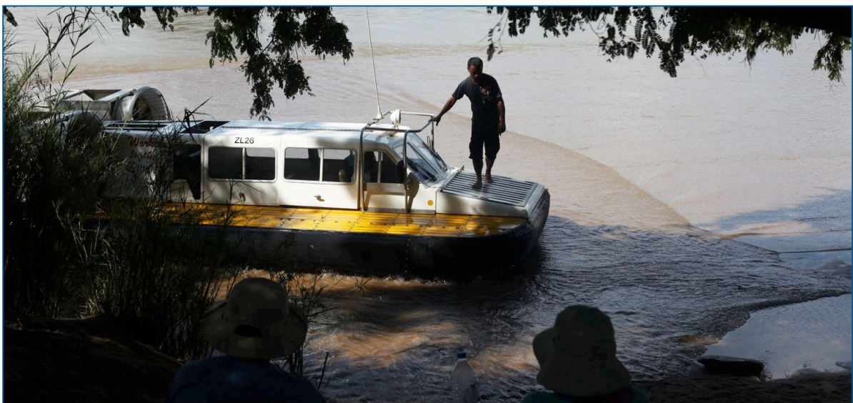
Hovercraft: hét transport middel van HoverAid

Op de bovenste foto is een waterfilter te zien welke gebruikt wordt door een gezin in het dorpje Ankatrongo. Een medewerker van HoverAid controleert of het filter goed gebruikt wordt. Er is een grote vraag naar nieuwe filters. De bevolking merkt dat ze minder ziek zijn waardoor veel andere gezinnen ook zo'n waterfilter willen hebben. HoverAid hoopt dit jaar nog 200 filters te maken.