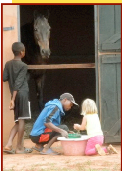
Paardrijden en de paarden eten geven is hun grootste hobby