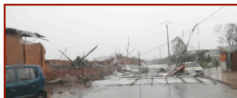
Schade van de cycloon

Het is cyclonen seizoen en we hebben al verschillende cyclonen over het eiland heen gehad. Twee weken geleden kwam orkaan Giovanna dwars over ons huis heen. Dat ging met een behoorlijke storm gepaard. Gelukkig kwam er niet zoveel regen mee waardoor de schade beperkt bleef. Sindsdien is er nog eentje over het noorden van het eiland gegaan die wel veel water gaf. Ook nu hebben we alweer behoorlijk wat dagen continue regen.